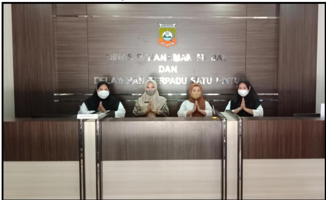
Gambar 2.1 Front Office Dinas Penanaman Modal dan Pelayanan Terpadu Satu Pintu Kabupaten Konawe Utara

Dinas Penanaman Modal dan Pelayanan Terpadu Satu Pintu Kabupaten Konawe Utara selanjutnya mendapat kewenangan melakukan penyelenggaraan perizinan dan non perizinan melalui Surat Keputusan Bupati Konawe Utara Nomor 81 Tahun 2017 tentang Pendelegasian Kewenangan Bupati Konawe Utara Kepada Kepala Dinas Penanaman Modal Dan Pelayanan Perizinan Terpadu Kabupaten Konawe Utara Untuk Melaksanakan Penyelenggaraan Perizinan dan Non Perizinan Di Kabupaten Konawe Utara.